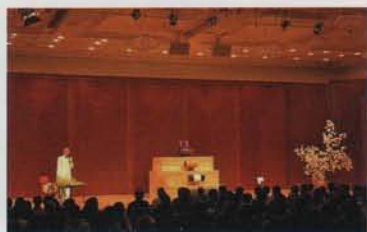
今年3月、東京のサントリーホール(小ホール)で波動スピーカーを使った「演奏家のいない演奏会」が開かれ、聴衆は音のシャワーにこころを揺さぶられました。

使ってみてとてもよいと思ったので、私は関わりのある岡山県のマタニティホスピタルと沖繩県の老人介護施設に、1台ずつ波動スピーカーをプレゼントさせていただきました。人生の始まりの場所と、人々が最後を過ごす場所、みなさんで、こころ豊かに素晴らしい音楽を楽しんでいただけたら、と思ったのです。喜びを増やし、悲しみを癒す。そんな役割を、波動スピーカーに果たしてほしいと願っています。