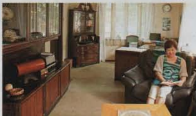
波動スピーカー 1台から、部屋の全方向に向かって音の広がりが生れます。

日本の外資系銀行勤務を経て、世界銀行本部で日本人初の人事マネジャー、カウンセラーを務め、帰国後独立。企業でのマネジメント・コンサルティングや研修、執筆、講演など幅広く活躍中。ベストセラー「世界がもし100人の村だったら」の原訳者としても知られる。最近ではソーシャルリス（社会の輪）という構想のもと、世界中の人々が有機的につながる社会のありかたを提唱。講演会などの詳しい情報は、公式HPへ。 http://www.romi-nakano.jp/